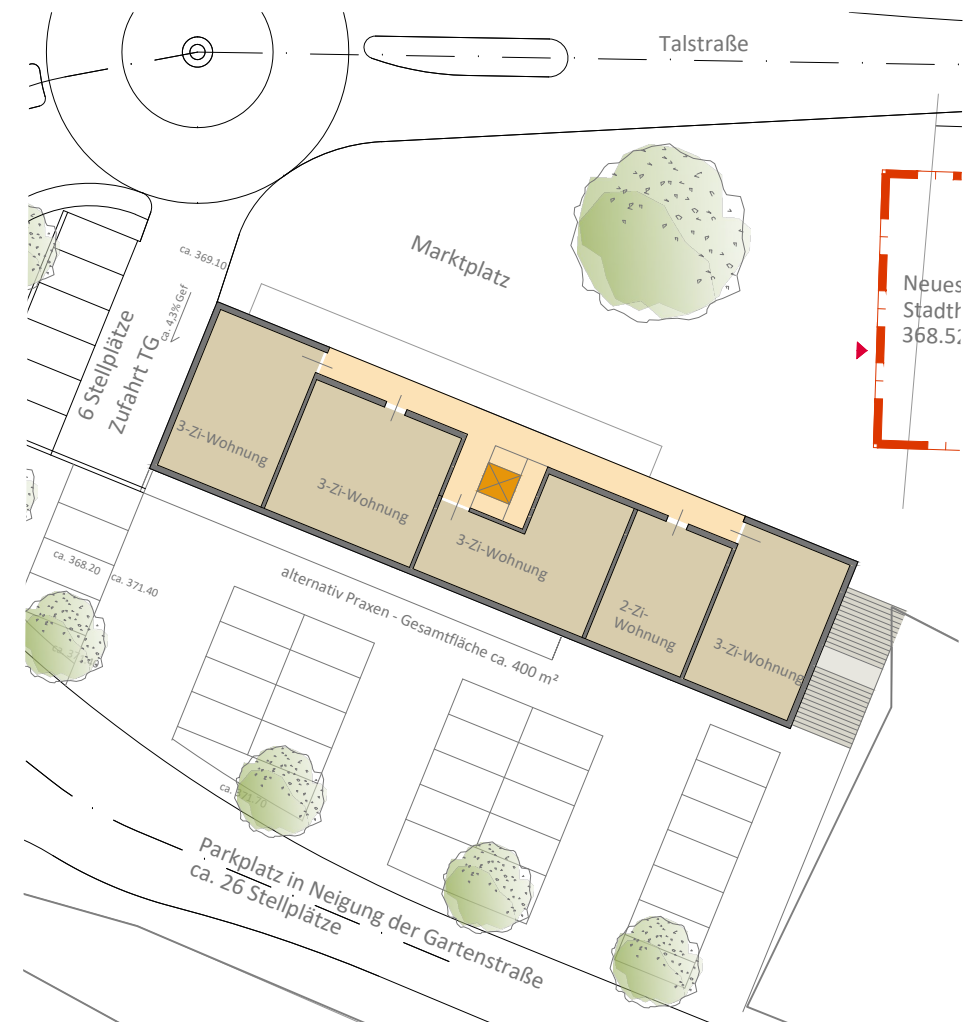
Ebene E2 - Wohnungen -Zufahrt TG überbaut