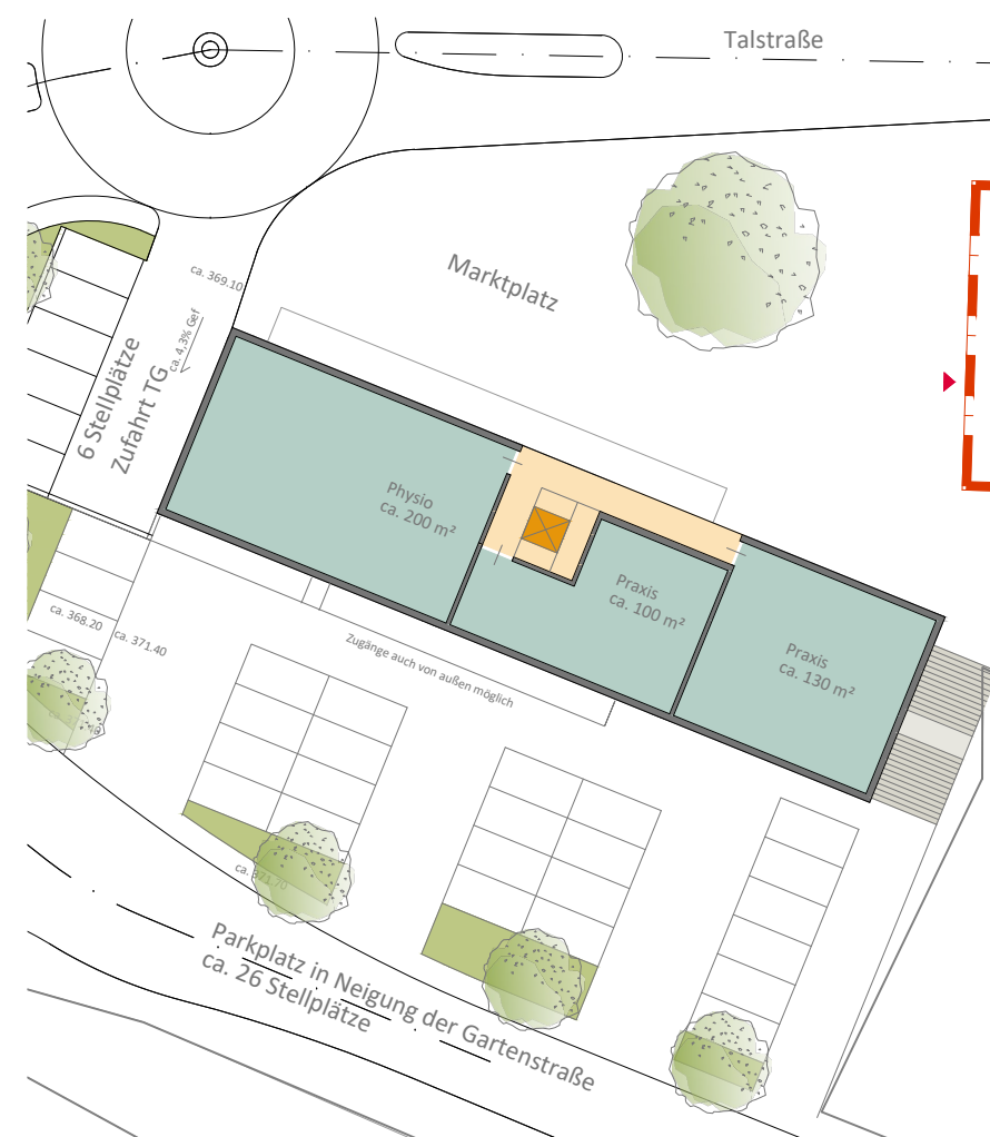
Ebene E1 - Praxen -Zufahrt TG überbaut